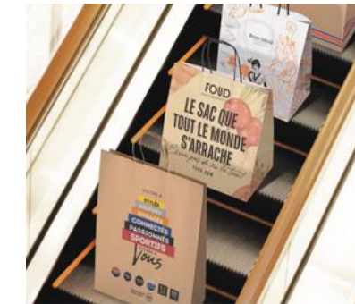
MILHE ET AVONS

Move Burger : Fabriquée à partir d'huile alimentaire recyclée, elle est entièrement recyclable