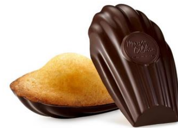
PÂTISSERIES GOURMANDES MAISON COLIBRI