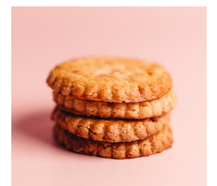
LA FABRIQUE COOKIE

De la pâte à cookie crue directement à la cuillère